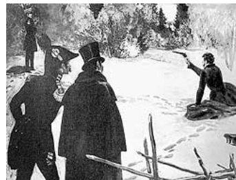
На Черной речке

К 170-летию со дня дуэли Пушкина Государственный музей А.С. Пушкина открывает выставку. Выставка рассказывает об истории дуэли между Александром Пушкиным и Жоржем Дантесом. Центральное место занимают материалы, связанные с дуэлью. Одним из экспонатов будет дуэльный набор 1) Дантеса. На выставку из Франции едут его дуэльные пистолеты, одним из которых на берегу Черной речки в Санкт-Петербурге был смертельно ранен 2) Пушкин.