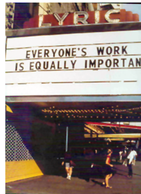
Ieders werk is even belangrijk

Holzer maakt geëngageerde kunst. Ze dwingt de beschouwer tot maatschappelijke betrokkenheid en probeert zoveel mogelijk mensen te bereiken. Dat kun je afleiden uit de locaties die ze kiest en uit de vormgeving die ze hanteert.